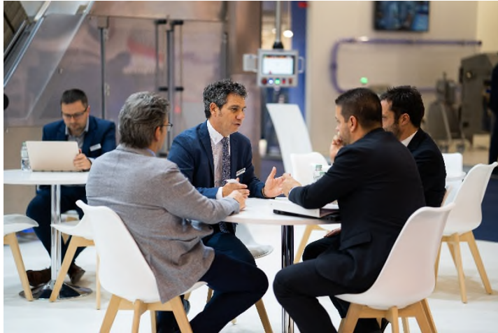
IFFA 2022: Jetzt als Aussteller anmelden

der Messe Frankfurt, erläutert diese Erweiterung in die digitale Sphäre: „Alle wichtigen Branchenplayer, von Start-Ups bis hin zu multinationalen Konzernen, waren schon bislang in der Produktsuche der Leitmesse zu finden. Nun können unsere Aussteller ihre Produkte mit Fotos, Videos und Kontaktdaten auch dauerhaft bewerben und jederzeit um Innovationen ergänzen. Wir sehen darin nicht nur jetzt, in Zeiten von Corona, sondern auch darüber hinaus eine wichtige digitale Erweiterung des Live-Events“. Der IFFA Contactor wird ab Mitte des Jahres 2021 über die IFFA-Website zu erreichen sein und sukzessive wachsen.